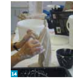
14 Workshop activities 15 Café 16 Visits for children