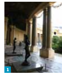
1 Peristyle 2 Front right of the Petit Palais 3 Entrance gates