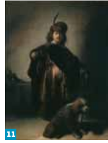
11 Rembrandt, Portrait de l'artiste en costume oriental 12 Icons gallery 13 J. Daret, La Présentation au Temple

In 1930, the Tuck donation was a delightful addition to this collection. It consists almost exclusively of 18th century works of art. Donations and bequests once again flooded the museum in 1998, when the collections of the Petit Palais were significantly enriched with a unique collection of Greek and Russian icons given by Roger Cabal. The museum then became the French public institution with the largest collection of icons. Collections have also been enriched with photographic acquisitions since 1998. The photography collection of the Petit Palais, which brings together ancient and contemporary works, offers a unique view of the history of the museum and its works.