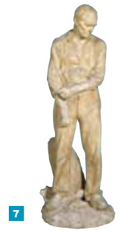
7 Dalou, Grand Paysan 8 Maestro Giorgiò - Plate - Le Jugement de Pâris 9 Courbet gallery 10 Alfred Sisley, Église de Moret

A collection of 19 th century French art One of the Petit Palais' two major collections includes late 19 th to early 20 th century French art, a collection constantly enriched through acquisitions, donations and bequests (Vollard, Carpeaux, Jacquaeu, etc.).